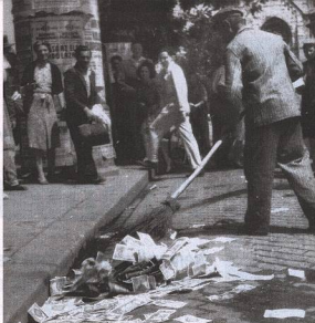
Fővárosi utcáké 1946 augusztusában. Söpörgetés

Pedig alig néhány hónapot kellett volna kibírni: május 23-án közölték, hogy augusztus 1-jén bevezetik az új, stabil pénzt, a forintot. Ugyanakkor döntöttek arról is, hogy papírpénzként is kibocsátják az adópengőt, mert az emberek ebben sokkal